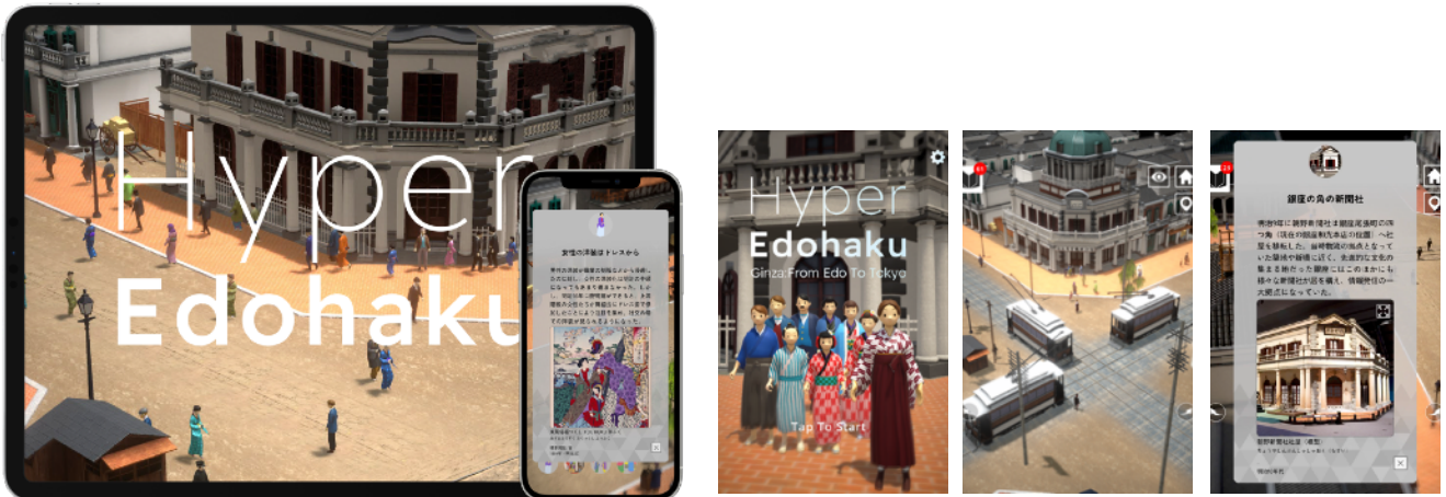
江戸東京博物館スマートフォンアプリ「ハイパー江戸博 明治銀座編」（4月26日リリース）

江戸博の収蔵品で「東京のはじまりをさがす、みつける、あつめる」 西洋化がすすむ明治時代の銀座を時間旅行しながら、 現代につながる文化や習慣を見つけよう