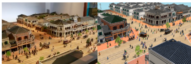
左：江戸東京博物館の銀座煉瓦街の模型 右：アプリの3DCG空間