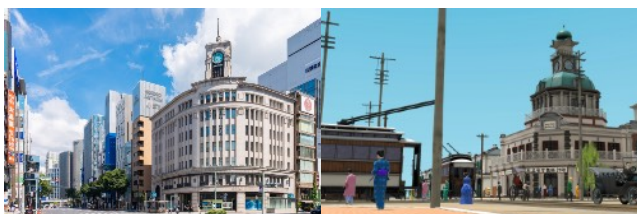
左：現在の銀座四丁目 右：アプリで再現された明治時代の街並み

第1弾と同様に、登場するキャラクターとの会話をヒントに、アプリに隠された收藏品を探すことに加え、第2弾では4つのステージで時間と場所を移動する「時間旅行」を楽しめます。さらに、收藏品の3Dデータを使ったAR機能が新たに加わりました。