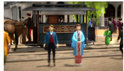
左：アキラくん 右：ハルちゃん

約260年続いた江戸時代が終わりを迎えた明治初年（1868年）から物語はスタートします。江戸と呼ばれていた都市は「東京」へその名を変え、明治時代が幕をあけます。西洋からの思想や技術、価値や文化を取り入れて近代国家へ躍進する日本。本アプリは、こうしたためまぐるしく変わる銀座の街、文明開化に生きた、ある家族の物語でスタートします。